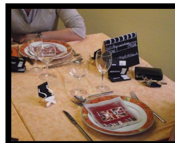
Préparation et service d'un déjeuner