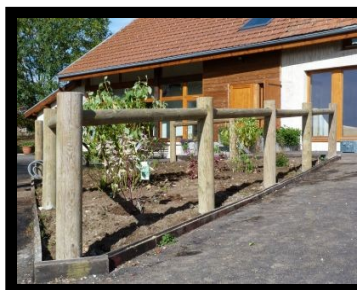
Pose de barrières et travaux paysagers